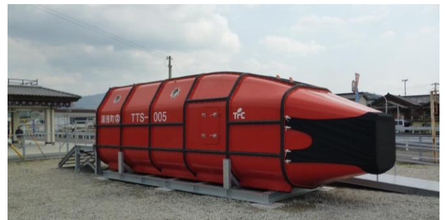
洪水の際の避難ボート