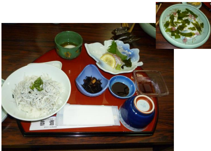
しらす丼としろうおの昼食