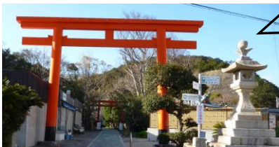
宿の隣にある 淡嶋神社の鳥居