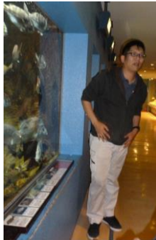
揖先生の講義 (自然博物館にて)