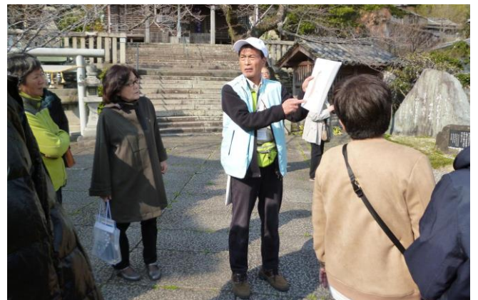
黒江町の町なみ散策