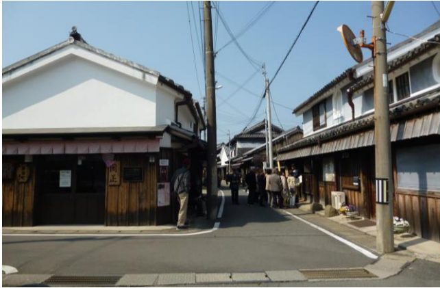
湯浅の町なみ散策